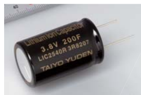
シリンダ型リチウムイオンキャパシタ