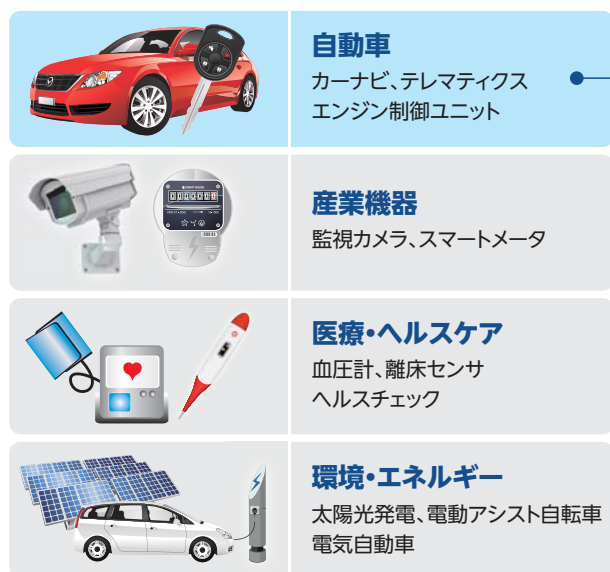
注力すべき市場の売上高構成比

比較的需要の安定した自動車、産業機器、医療・ヘルスケア製品、環境・エネルギー市場において、電子化が加速しています。こうした高信頼性が求められる市場に対し、耐高温・長寿命・高品質を満たす商品のラインアップ拡充を目指すとともに、デザイン・イン活動の促進等を通じた販路拡大を図っています。