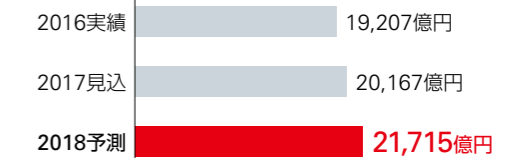
■ コンデンサの市場規模(暦年)