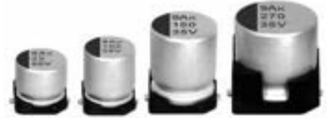
表示色 : ケース頭部に青色印刷